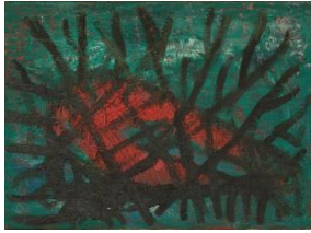
Fahrelnissa Zeid (1901 Buyukada - 1991 Amman) Title unknown n.d Oil on canvas 55.5 x 75.5 cm MAT.2007.1.458

فخر النساء زيد (١٩٠١ بويوكادا - ١٩٩١ عمّان) العنوان غير معروف بدون تاريخ ألوان زيتية على قماش ٥١ x ٥١ سم MAT.2007.1.456