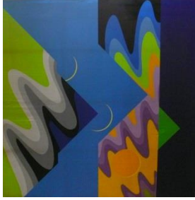
Mohammed Melehi (1936 Asilah - lives and works between Marrakesh and Tangier) Three Crescents 1984 Vinylic paint on plywood board 150 x 150 cm MAT.2007.1.318

محمد المليحي (١٩٣٦ أصيلة - يقيم ويعمل بين مراكش وطنجة) ثلاثة أهلة ١٩٨٤ طلاء الفينيل على لوح خشبي ١٥٠ x ١٥٠ سم MAT.2007.1.318