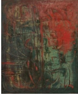
Fahrelnissa Zeid (1901 Buyukada - 1991 Amman) Title unknown n.d Oil on canvas 51 x 51 cm MAT.2007.1.456

فخر النساء زيد (١٩٠١ بويوكادا - ١٩٩١ عمّان) العنوان غير معروف بدون تاريخ ألوان زيتية على قماش ٥١ x ٥١ سم MAT.2007.1.456