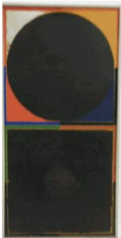
Syed Haider Raza (1922 Mandla district - 2016 New Delhi) Untitled 1986 Acrylic on paper 103.5 x 51 cm MAT.2011.14.1