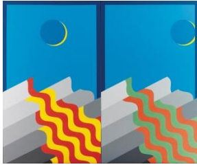
Mohammed Melehi (1936 Asilah - lives and works between Marrakesh and Tangier) Diptyque de Grenoble 1981 Acrylic on canvas 200 x 240 cm MAT.2007.1.316

This gallery brings together historical and contemporary works that see artist's systematically exploring the volume and density of space through fragmentation, modularity, and repetition in painting and sculpture, expressing perceptions on the intensity of life and enacting ways to make order of the world.