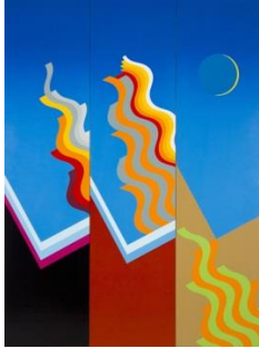
Mohammed Melehi (1936 Asilah - lives and works between Marrakesh and Tangier) Blue Moon 1984 Cellulosic paint on wood panel 199 x 148.5 cm MAT.2007.1.317

محمد المليحي ١٩٣٦ أصيلة - يقيم ويعمل بين مراكش وطنجة) اللوحة المزدوجة ١٩٨١ ألوان الأكريليك على قماش ٢٤٠ x ٢٠٠ سم MAT.2007.1.316