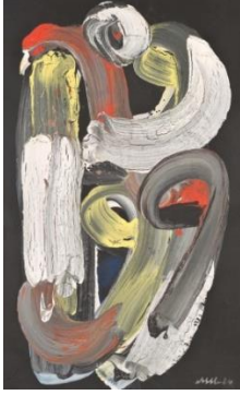
Hamed Abdalla (1917 Cairo - 1985 Paris) Wifq (Harmony) 1969 Mixed media on hardboard 100 x 61 cm MAT.2009.6.14

حامد عبدالله (١٩١٧ القاهرة - ١٩٨٥ باريس) وفق ١٩٦٩ وسائط مختلفة على لوح صلد ١٠٠ × ٦١ سم MAT.2009.6.14