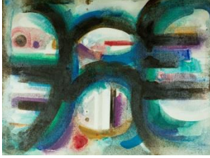
Ahmed Cherkaoui (1934 Boujad - 1967 Casablanca) Les humbles commencements de la pensée et du langage (The humble beginning of thought and language) 1967 Oil on canvas 97 x 130 cm MAT.2007.1.1696

أحمد الشرفاوي (١٩٣٤ بوجعد - ١٩٦٧ الدار البيضاء) البداية المتواضعة للفكر واللغة ١٩٦٧ ألوان زيتية على قماش ٩٧ x ١٣٠ سم MAT.2007.1.1696