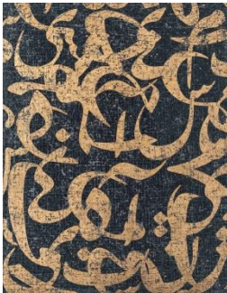
Farhad Moshiri (1963 Shiraz - lives and works between Tehran and Paris) Y84M 2006 Acrylic and Gold paint on canvas 190 x 150 cm MAT.2015.4.1

علي حسن (١٩٥٦ الدوحة - يقيم ويعمل في الدوحة) نون ١٩٩٦ ألوان الأكريليك على ورق ٧٥ x ١١٠ سم MAT.2007.1.1788