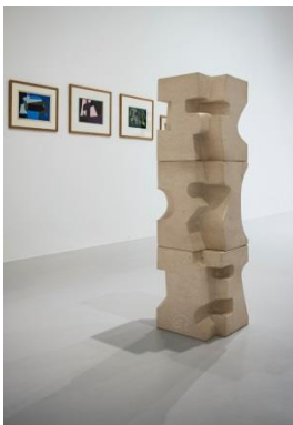
Saloua Raouda Choucair (1916 - 2017 Beirut) Movement of the Angle 1983 - 1985 Limestone 131.5 x 35 x 36 cm MAT.2014.7.21

إيتيل عدنان (١٩٢٥ بيروت - تقيم وتعمل في باريس وسوساليتو) بدون عنوان ١٩٧١ وسائط مختلفة على ورق ١٨ x ٥٣٠ سم MAT.2015.2.2