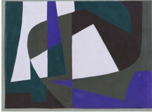
Saloua Raouda Choucair (1916 - 2017 Beirut) Rhythmical Composition 1951 Gouache on paper 33 x 24.5 cm MAT.2014.7.25

سلوى روضة شقير (١٩١٦ - ٢٠١٧ بيروت) تأليف إيقاعي مع أبو هول الأبيض ١٩٥١ ألوان زيتية على قماش ٨٨ x ١١٦ سم MAT.2014.7.27