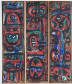
Ahmed Cherkaoui (1934 Boujad - 1967 Casablanca) Les trois sœurs (The Three Sisters) 1963 Oil on canvas 152 x 130 cm MAT.2015.22.5

عمر النجدي (١٩٣١ القاهرة - يقيم ويعمل في القاهرة) الواحد ١٩٦٠ ألوان زيتية على قماش ١٥٤ x ١٥٢ سم MAT.2008.11.4