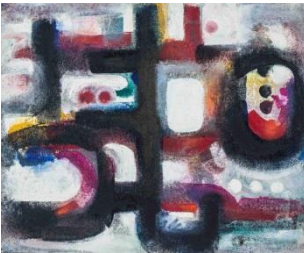
Ahmed Cherkaoui (1934 Boujad - 1967 Casablanca) Talisman Rouge 1967 Oil on canvas 81 x 100 cm MAT.2013.13.25

أحمد الشرقاوي (١٩٣٤ بوجعد - ١٩٦٧ الدار البيضاء) الأخوات الثلاث ١٩٦٣ ألوان زيتية على قماش ١٥٢ x ١٣٠ سم MAT.2015.22.5