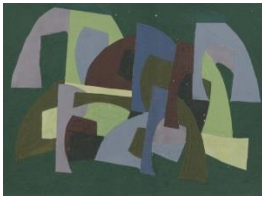
Saloua Raouda Choucair (1916 - 2017 Beirut) Fractional Module 1959 Gouache on paper 24 x 33 cm MAT.2014.7.23

سلوى روضة شقير (١٩١٦ - ٢٠١٧ بيروت) تأليف إيقاعي ١٩٥١ ألوان الغواش على ورق ٣٣ x ٢٤,٥ سم MAT.2014.7.25