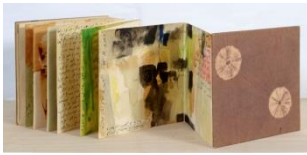
Etel Adnan (1925 Beirut - lives and works in Paris and Sausalito) Allawn wa Alrasm (color and drawing) 1971 Watercolor on paper 18 x 530 cm MAT.2015.2.1

أحمد الشرفاوي (١٩٣٤ بوجعد - ١٩٦٧ الدار البيضاء) البداية المتواضعة للفكر واللغة ١٩٦٧ ألوان زيتية على قماش ٩٧ x ١٣٠ سم MAT.2007.1.1696