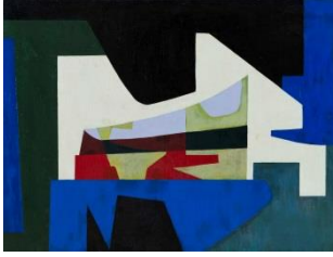
Saloua Raouda Choucair (1916 - 2017 Beirut) Rhythmical Composition with White Sphinx 1951 Oil on canvas 88 x 116 cm MAT.2014.7.27

سلوى روضة شقير (١٩١٦ - ٢٠١٧ بيروت) تأليف إيقاعي مع أبو هول الأبيض ١٩٥١ ألوان زيتية على قماش ٨٨ x ١١٦ سم MAT.2014.7.27