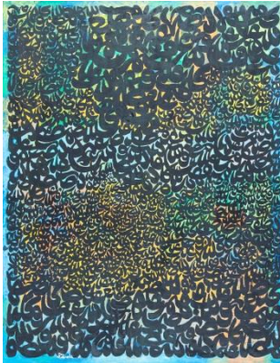
Hossein Zenderoudi (1937 Tehran - lives and works in Paris) Title unknown 1968 Acrylic on canvas 146 x 140 cm MAT.2008.15.27

سلوى روضة شقير (١٩١٦ - ٢٠١٧ بيروت) قصيدة ١٩٦٠ ألومنيوم ٣٥ × ١٦,٥ × ٧ سم MAT.2009.3.20