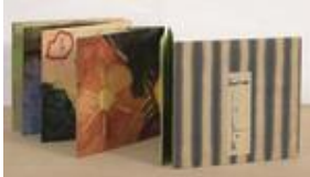
Etel Adnan (1925 Beirut - lives and works in Paris and Sausalito) Untitled 1971 Mixed media on paper 18 x 530 cm MAT.2015.2.2

إيتيل عدنان (١٩٢٥ بيروت - تقيم وتعمل في باريس وسوساليتو) اللون والرسم ١٩٧١ ألوان مائية على ورق ١٨ x ٥٣٠ سم MAT.2015.2.1