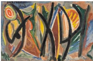
Jilali Gharbaoui (1930 Jorf El Melha - 1971 Paris) Title unknown 1967 Oil on canvas 64.5 x 98 cm MAT.2011.1.18

حسين زندرودي (١٩٣٧ طهران - يقيم ويعمل في باريس) العنوان غير معروف ١٩٦٨ ألوان الأكريليك على قماش ١٤٦ × ١٤٠ سم MAT.2008.15.27